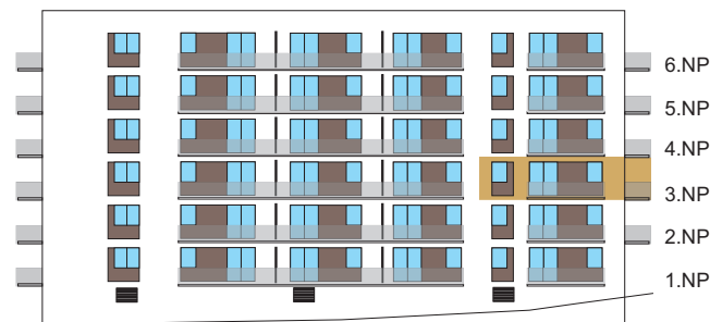
Západní pohled na dům/ Building View - West side